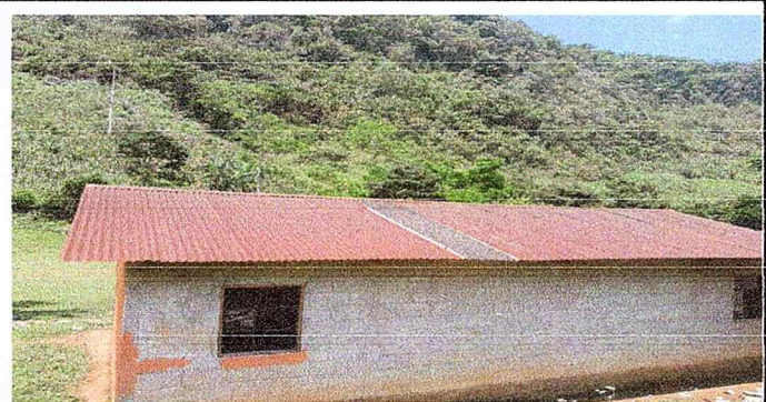
Foto 1: EL TECHO DE ESTA ESCUELA SE VA SUSTITUIR SE VA REMODELAR.